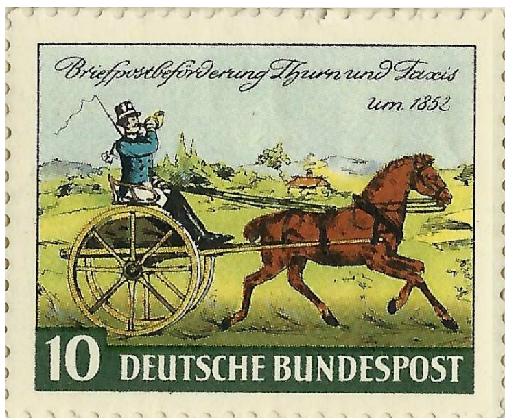
Sondermarke der Deutschen Bundespost zum 100. Jahrestag der Erstaussgabe von Thurn und Taxis - Briefmarken (1952)

Mit allmählicher Verbesserung der Wegverhältnisse konnten im 18. und 19. Jahrhundert Fahrposten eingerichtet werden, mit denen Reisende und Postgut, vor allem Briefe und Pakete, befördert wurden. In Deutschland war es insbesondere das Regensburger Fürstenhaus Thurn und Taxis, das mit Organisation und Betrieb dieses Netzes von Poststationen beauftragt war. Daran erinnert die hübsche Sondermarke der Bundespost, Mi.-Nr. 160, aus dem Jahre 1952. Aber auch die vielen Hotels und Gasthäuser „Zur Post“ erinnern uns an diese früheren Poststationen, wo Postillion und Pferde gewechselt wurden und sich die durchgerüttelten und staubbedeckten Reisenden „restaurieren“ konnten. (Endlich weiß man, woher der Name „Restaurant“ kommt). Erst mit Bau der ersten Eisenbahnen ab Mitte des 19. Jahrhunderts verlagerte sich die Personen- und Postbeförderung auf dieses neue Verkehrsmittel.