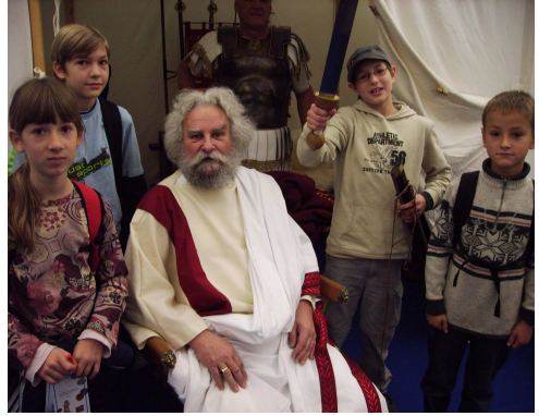
Die Römertage in Sindelfingen

Wer Freude an Briefmarken hat und Erlebnisse in einer Gruppe schätzt, ist herzlich willkommen. Die Mädchen / Jungen (etwa 9 – 14 Jahren alt) treffen sich einmal im Monat stets am Freitag von 15 – 16:30 Uhr im Salemer Hof in Nürtingen. (Der Zugang zum Vereinsraum im Untergeschoß erfolgt durch den Turm auf der Rückseite des Gebäudes, also von der Mönchgasse her.)