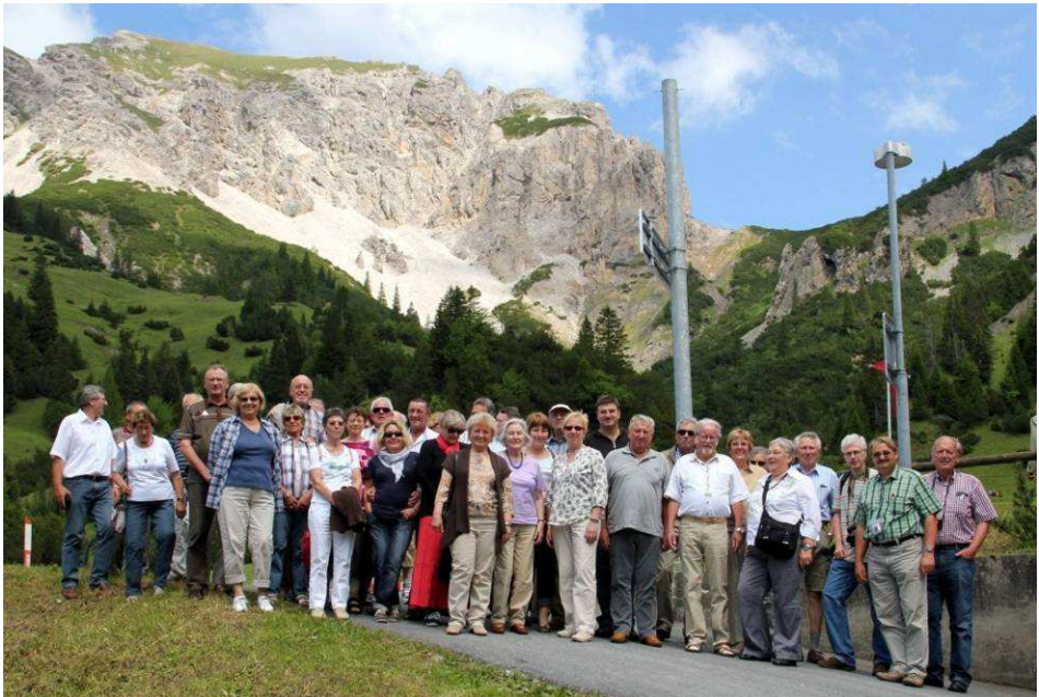
Unsere stattliche Reisegruppe in Malbun

Nachdem sich das Wetter im Laufe des Tages immer mehr besserte, nahm man noch einen Abstecher nach Malbun ins Programm auf. Hier, in herrlicher Bergwelt, konnten sich unsere Briefmarkenfrennde davon überzeugen, dass es nicht nur für Philatelisten, sondern auch für Wander- und Naturfreunde, im Winter natürlich besonders für Skifahrer, von größtem Reiz ist, das kleine Land zu besuchen. Wie es guter Brauch ist, klang unser Ausflug mit einem gemütlichen Zusammensein aus – dieses Mal bei Allgäuer Gastlichkeit in der Traditionsbrauerei Härle in Leutkirch. Regional geprägte Küche in bester Qualität, flotte Bedienung und angemessene Preise – so wie man es hierzulande schätzt! Schade nur, dass man wegen der maximalen Busfahrzeit von 15 h auf die Uhr schauen und bald wieder aufbrechen musste. Mit dieser Einkehr war ein harmonischer Schlusspunkt unter einen weiteren gelungenen Vereinsausflug gesetzt worden.