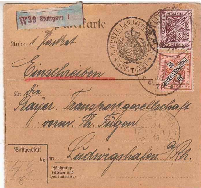
Paketkarte mit interessantem Dienstsiegel des Württ. Landespolizeiamts