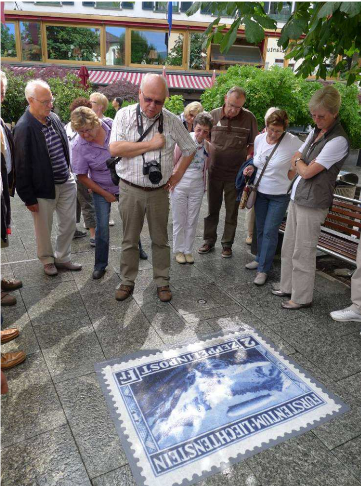
Bekannte liechtensteinische Briefmarken als Pflastermalerei in Vaduz

Im Fürstentum Liechtenstein feiert man heuer das Jubiläum „100 Jahre liechtensteinische Briefmarken“. Im Jahre 1912 waren die ersten eigenständigen Marken herausgegeben worden, nach langen Streitigkeiten mit dem damaligen K. K. Handelsministerium in Wien. Nachdem dieses Sammelgebiet in unserem Verein gut vertreten ist, war damit die Entscheidung über das Ziel des diesjährigen Ausflugs rasch gefunden worden: Am 07. Juli steuerte man mit dem Bader-Bus und mit erfreulich vielen Teilnehmern – es waren 43 an der Zahl – das Ländle zwischen Alpenrheine und Rätikon an.