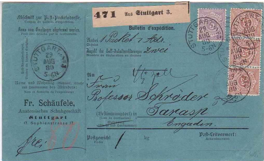
Sauber abgestempelte Paketkarte von Stuttgart ins Engadin