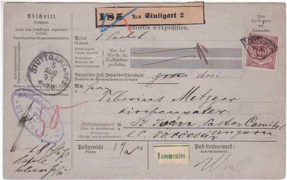
Begleitkarte zu einem Paket nach Ungarn mit interessanter Stempelkombination