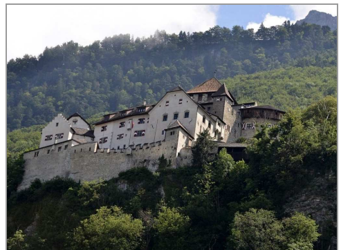
Schloss Vaduz