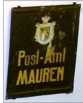
Postschilder im Postmuseum Vaduz