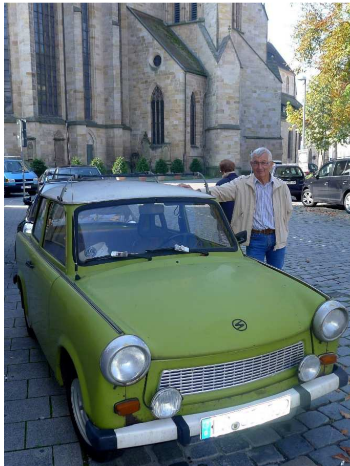
Einen „Trabi“ haben unsere französischen Freunde noch nie gesehen