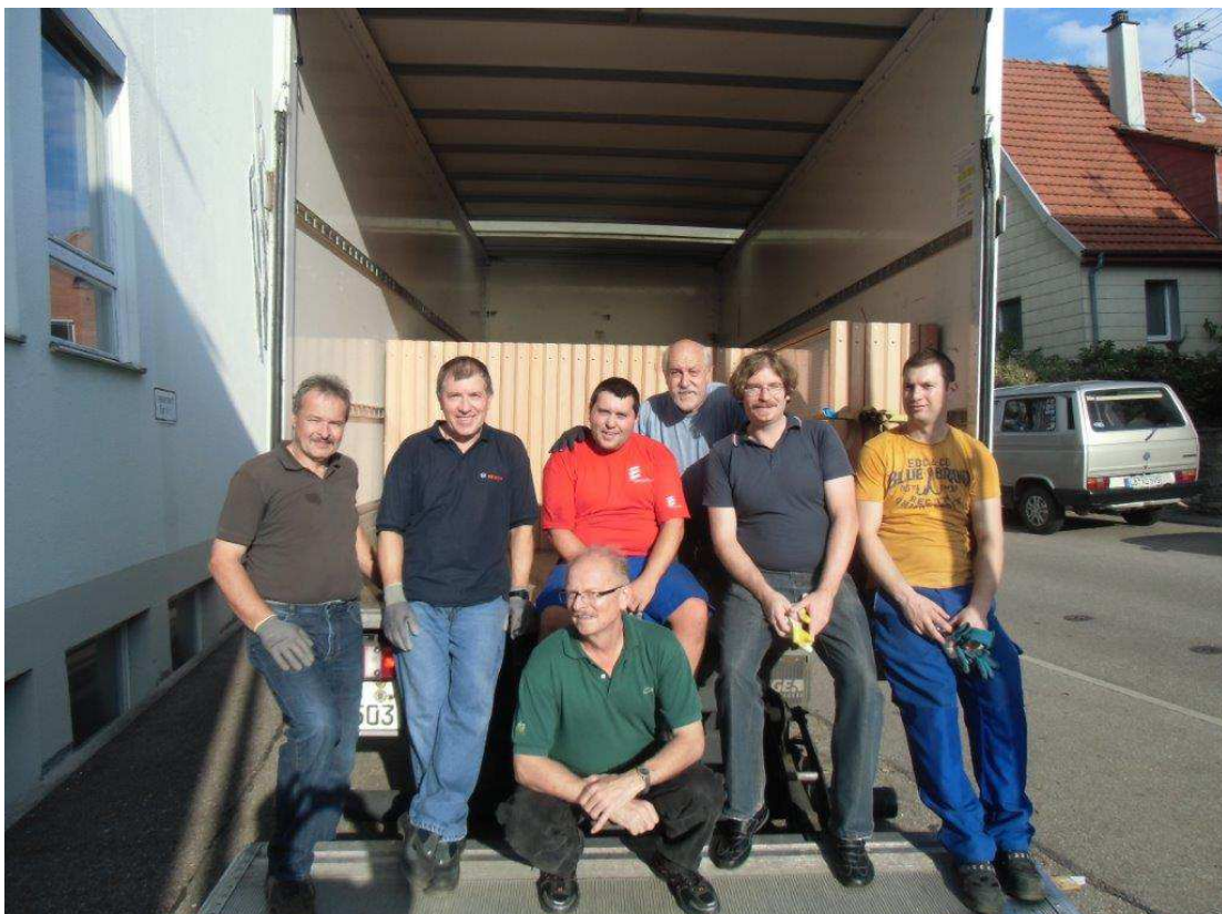
Diese Fotos der SÜDWEST – Nürtingen 2014 haben denen, die zur Ausstellung gekommen waren, besondere Momente nochmals in Erinnerung gerufen, allen anderen sollen sie zeigen, dass die Veranstaltung sehens- und erlebenswert war und dass die Ferngebliebenen etwas versäumt haben.