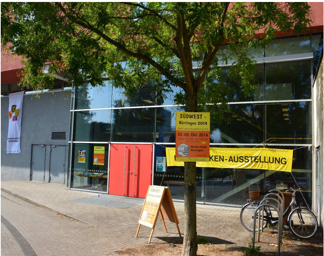
Alles ist gerichtet für die SÜDWEST – Nürtingen 2014 in der Mörikehalle