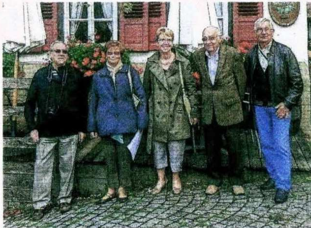
■ Oullins et Nürtingen, unis dans l'échange et la rencontre.

Grâce aux liens tissés depuis trente ans, l'occasion était de se retrouver entre amis « en famille », pour, bâtir des ponts d'homme à homme, c'est ainsi que l'Association philatélique comprend le jume-