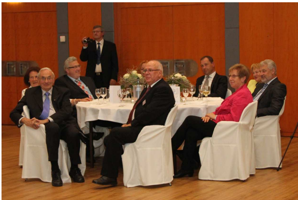
Der Tisch mit unseren Ehrengästen