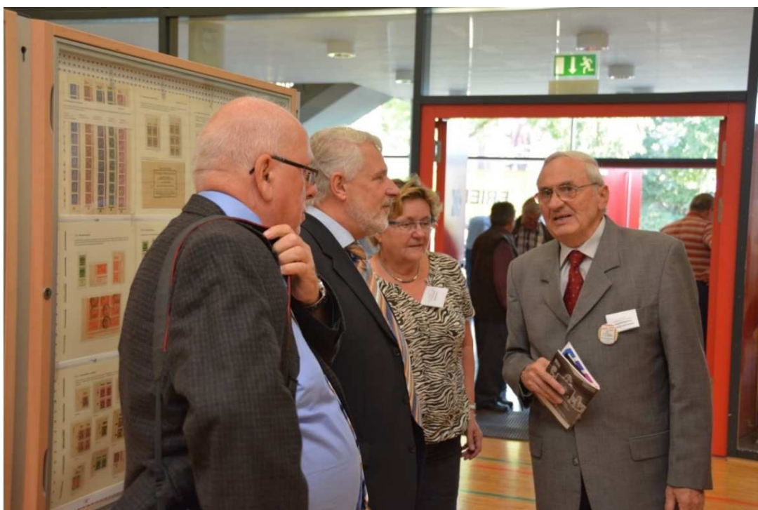
... wenig später beim ersten Rundgang durch die Ausstellung