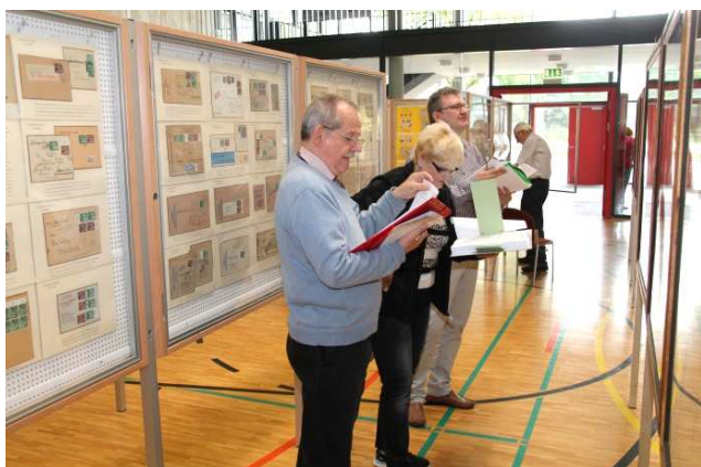
Juroren bei ihrer Arbeit