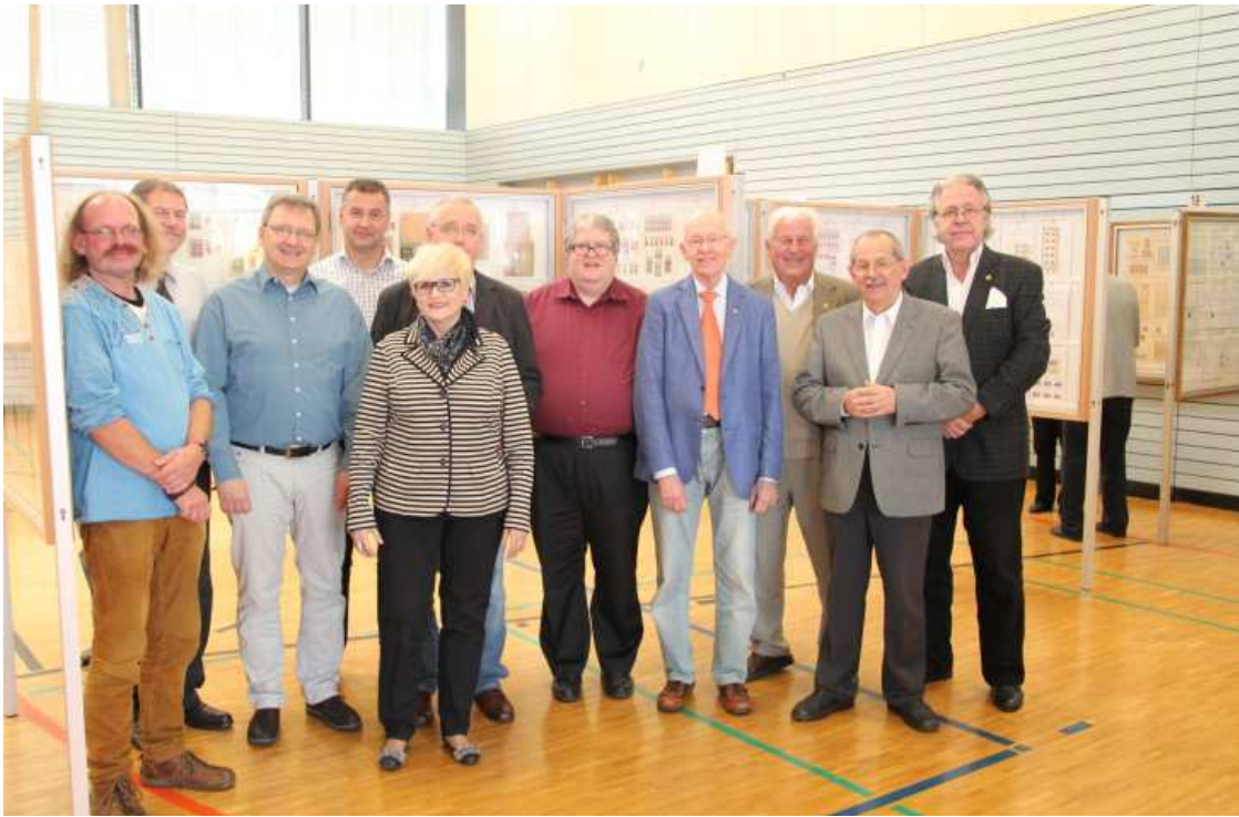
Die 11 Juroren haben ihren Dienst mit Engagement erledigt; sie verabschiedeten sich aus der Mörkehalle und überlassen sie den Mitarbeitern des Auf- und Abbau-Teams, insbesondere den Männern des „Rollkommandos“