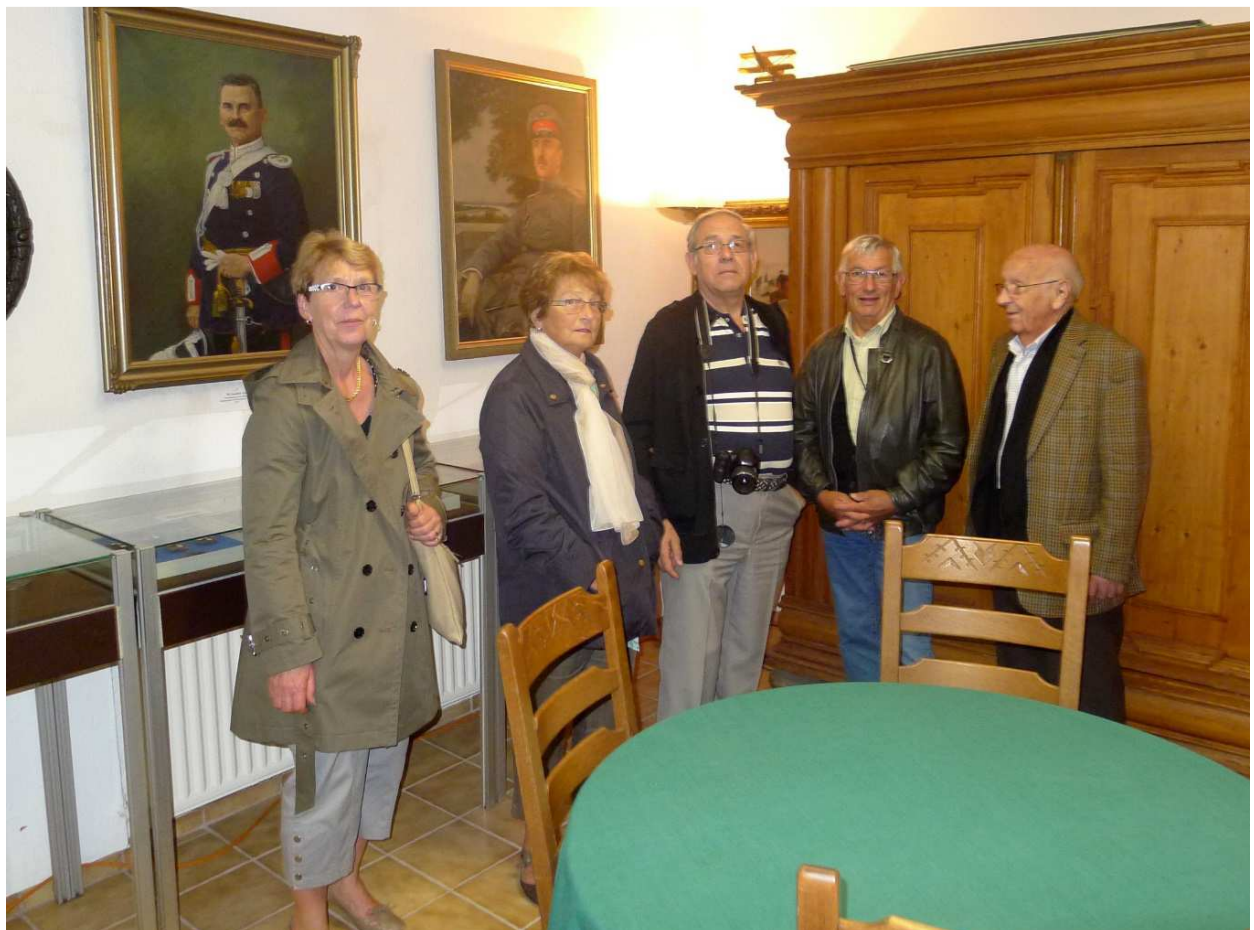
Im Ordensmuseum Neuffen