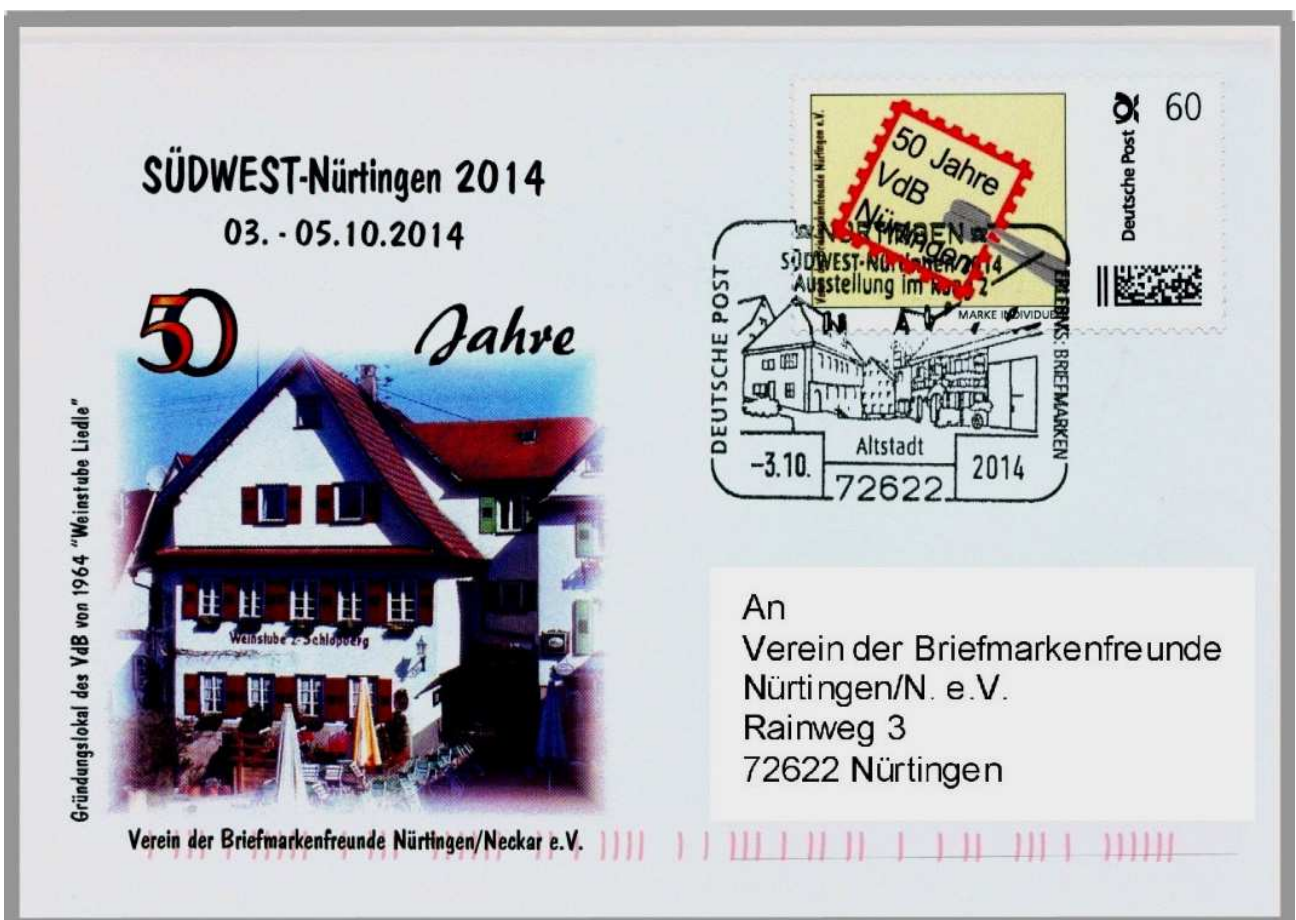
Sonderumschlag mit Motiv „Liedle“, echt gelaufen mit Sonderstempel „Altstadt Nürtingen“ und individueller Marke