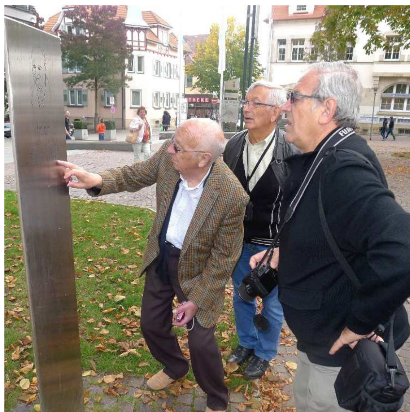
Beim intensiven Studium des Textes auf der Stele an der Kreuzkirche