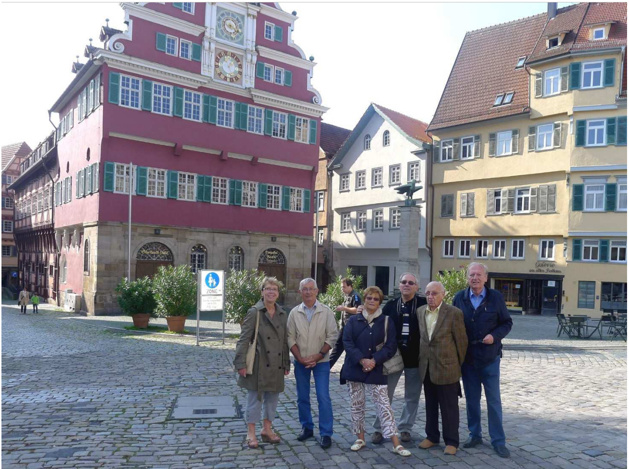
Besichtigung der Altstadt von Esslingen – hier vor dem Alten Rathaus