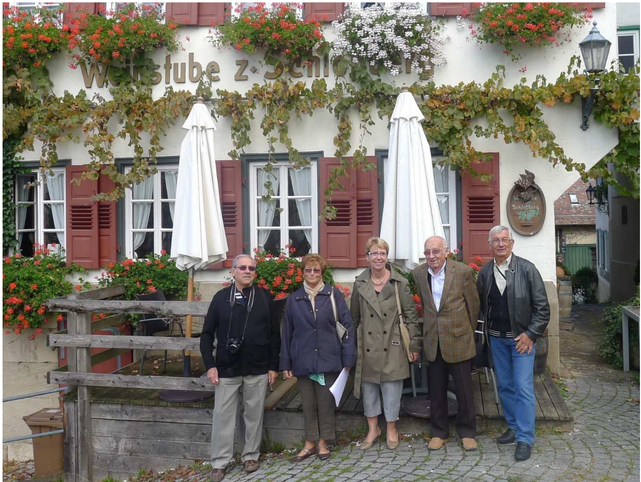
Die Gruppe aus Oullins vor unserem Gründungslokal, dem früheren „Liedle“