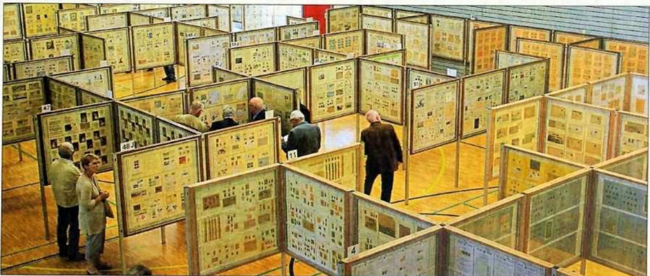
84 Schautafeln zu verschiedenen Themengebieten zeigt die Ausstellung.