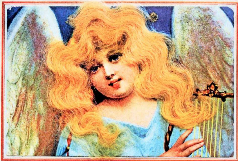
BLOND GELOCKTER ENGEL MIT GLITZERNDEN FLÜGELN BEIM HARFENSPIEL GEMALT VON EINEM UNBEKANNTEN KÜNSTLER

Unter dem Hinweis auf die 20 Wettbewerbsbeiträge junger Briefmarkensammler stellte der Rathauschef fest, dass das