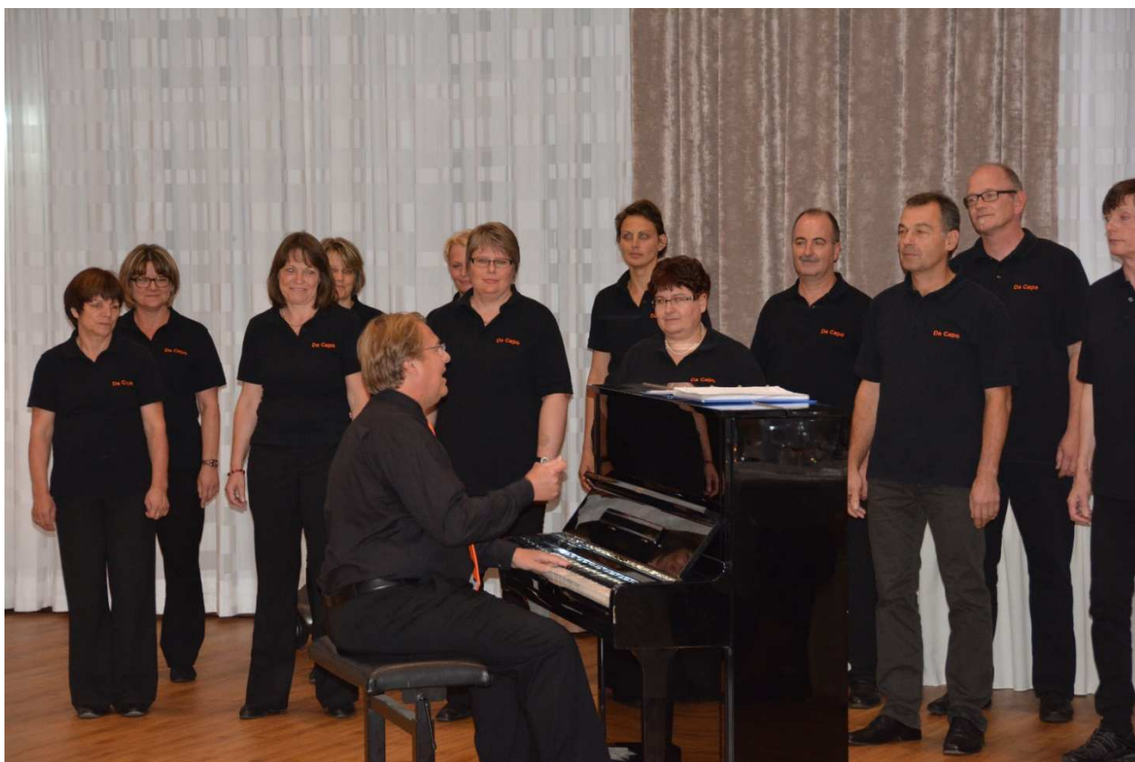
Der Chor „Da Capo“ in voller Aktion