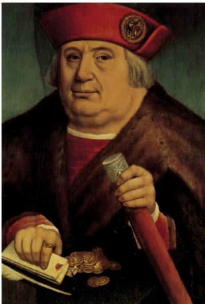
Franz von Taxis / 1459 - 1517 / Originalunterschrift v. 1505

Franz von Taxis wird 1491 erstmals zusammen mit seinem jüngeren Bruder Janetto in den "Raitbücher" der Tiroler Kammer in Innsbruck erwähnt. Der Beginn der organisierten "Post"