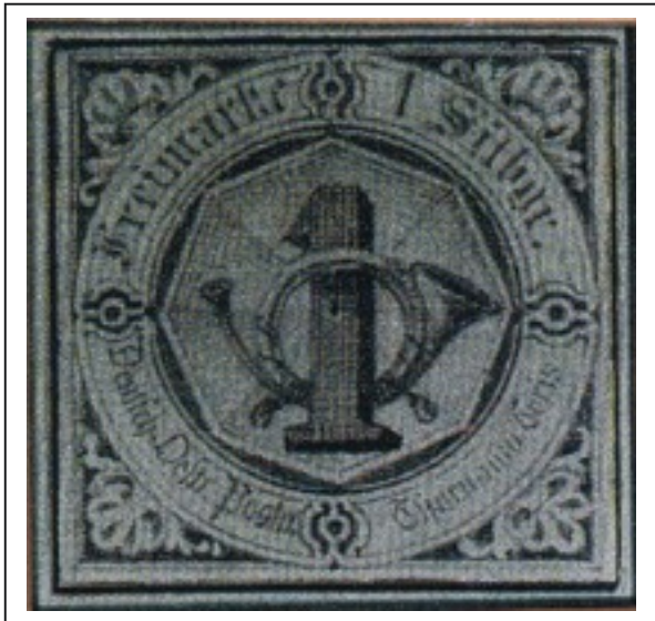
Herbst 1851: Nicht angenommene Bleistift-Entwurfszeichnung Entwurf Nr. 8 von der Fa. Naumann aus Frankfurt am Main