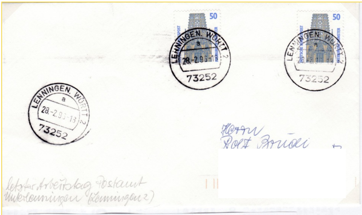
Brief von Lenningen Württ 2 nach Nürtingen. Stempel 28.2.96