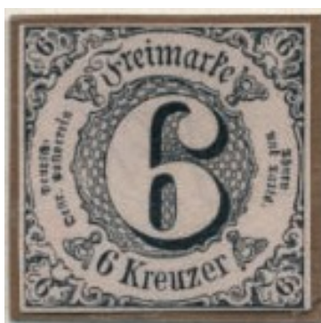
6 Kreuzer, Katalog Nr. 9