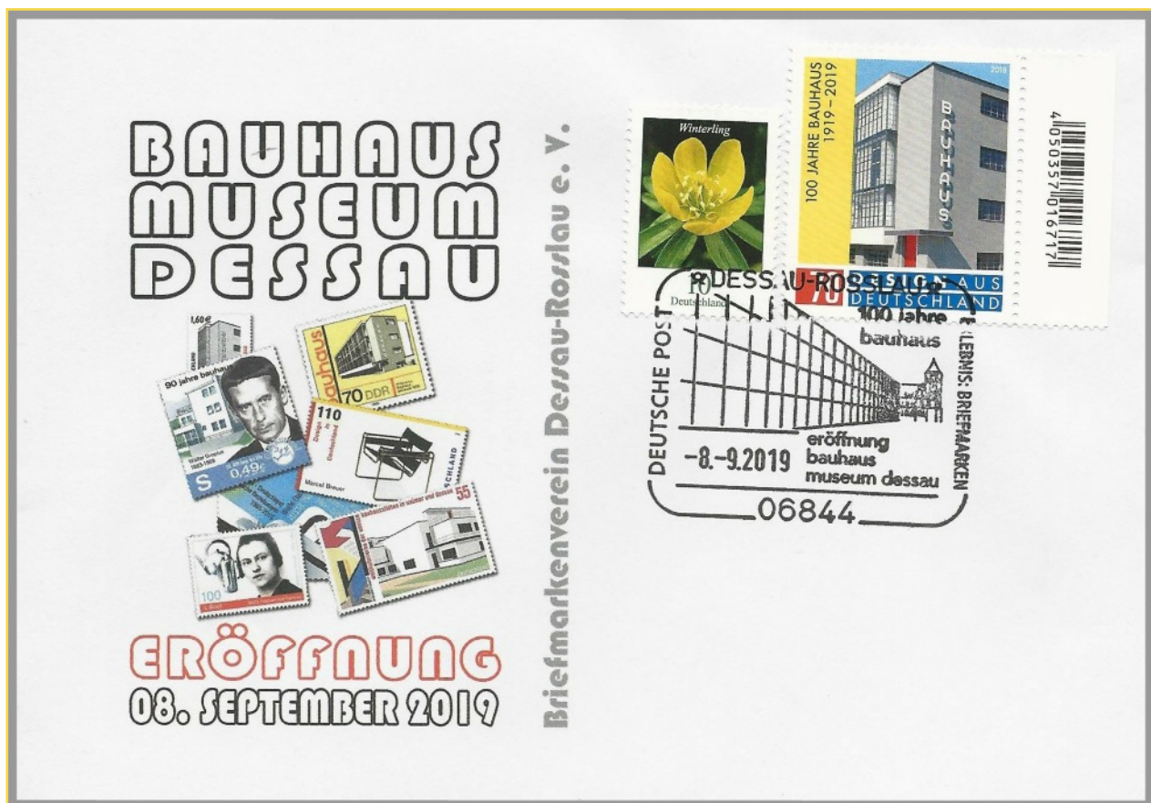
Beleg zur Eröffnung des Bauhaus-Museums in Dessau am 9. Sept. 2019