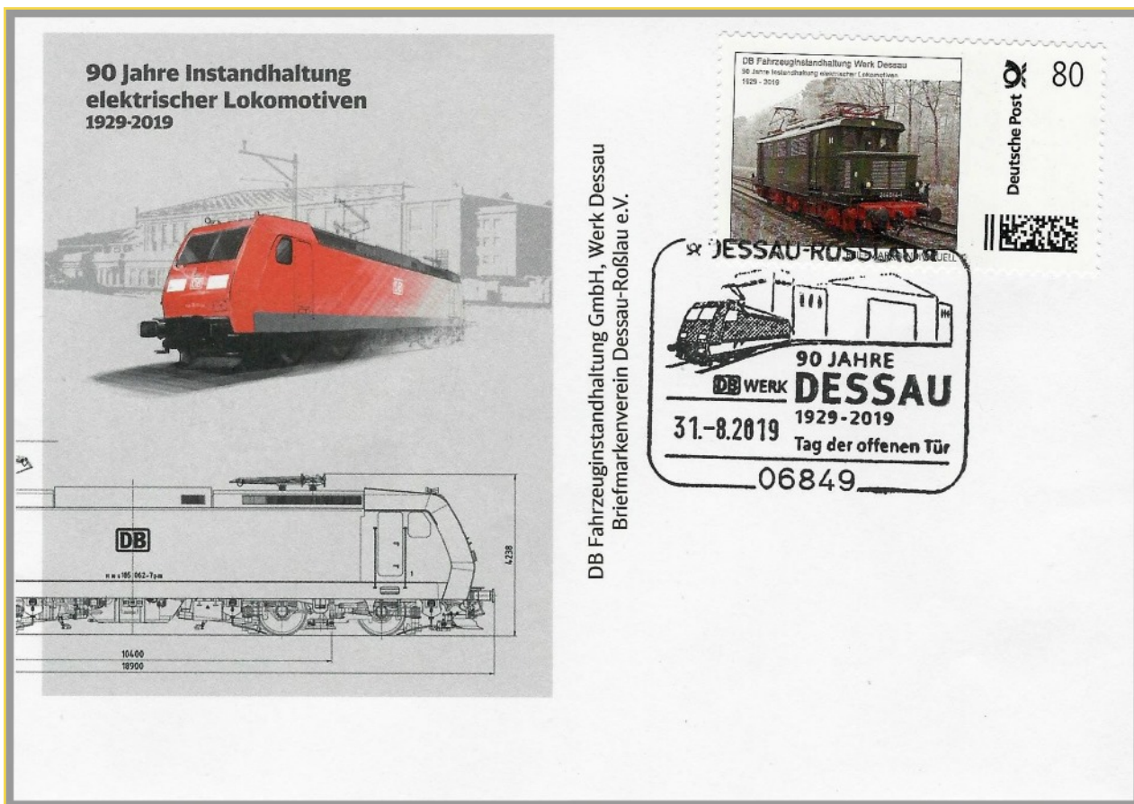
Beleg zu „90 Jahre Instandhaltung elektrischer Lokomotiven in Dessau-Rösrlau“