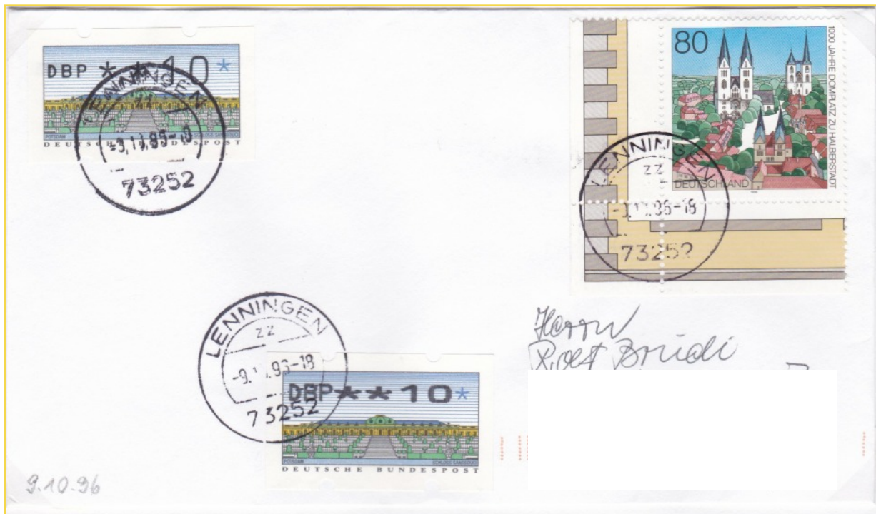
Brief von Lenningen (Postagentur) nach Nürtingen am 9.10.1996. Neuer Stempel der Postagentur Lenningen (zz)

Wir können hier feststellen, dass die Umstellung von Postfiliale zu Postagentur in Lenningen nicht genügend Vorlaufzeit hatte, so dass die Postagentur noch den Original – Stempel der Postfiliale verwendete. Erst am 9.10.1996 war dann der neue Stempel verfügbar und auch dazu gibt es einen passenden Beleg: