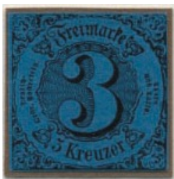
3 Kreuzer, Katalog Nr. 8

Die 5 Ausgaben (Emissionen) wurden in 14 Auflagen hergestellt. Die 1. Ausgabe mit zwei Erganzungswerten, Mi.-Nr. 1. bis 12., wurde