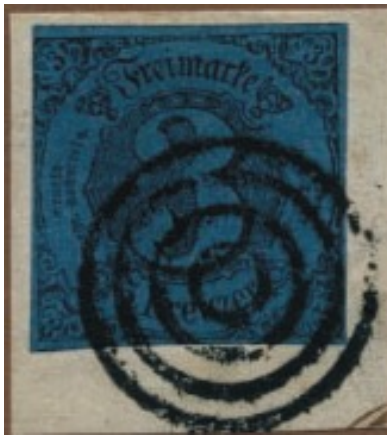
Die Stempel als Zierde von Thurn und Taxis