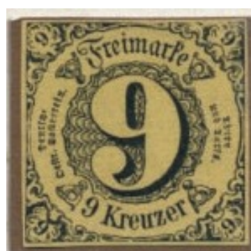
9 Kreuzer, Katalog Nr. 10

Im Hohenzollerengebiet Sigmaringen-Hechingen waren die ersten vier Kreuzer-Marken ab Donnerstag, dem 1. Juli 1852 gultig