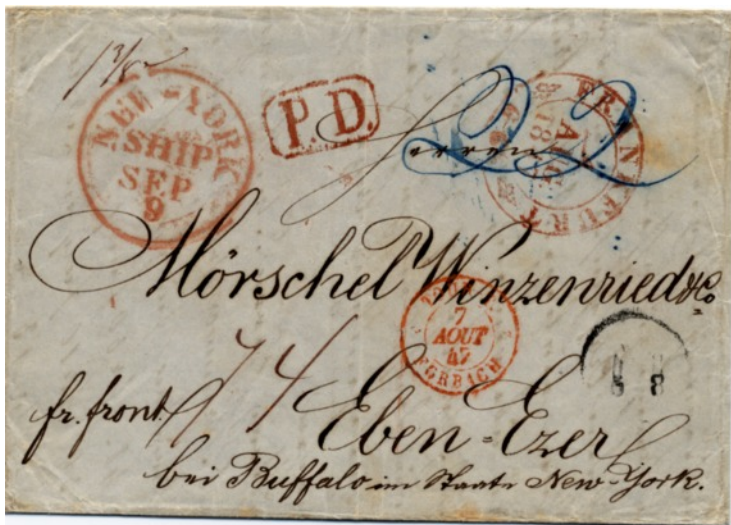
Auslandsbrief aus der Vormarkenzeit von Frankfurt am Main nach Eben Ezer / USA

Im Laufe der Zeit steigerte sich der Postverkehr immer mehr. Am Anfang konnten sich nur Adelige, die Kirche und reiche Geschäftsleute (Patrizier) den Luxus der Post leisten. Da die Postverbindungen und Wegstrecken in Deutschland sehr kompliziert waren, wurden die Briefe als "Porto-Briefe" verschickt, das heißt, der Empfänger zahlte das angefallene Porto. Die ersten Briefe in der Vormarkenzeit, auch „Vorphilatelie“ genannt, waren sogenannte "Schnörkelbriefe" mit handgeschriebenen Aufgabevermerke (locus unde).