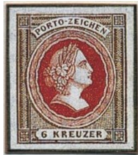
Januar 1859: Abgelehnter Entwurf mit Motiv der Francofortia von Fa. Henning, Greiz