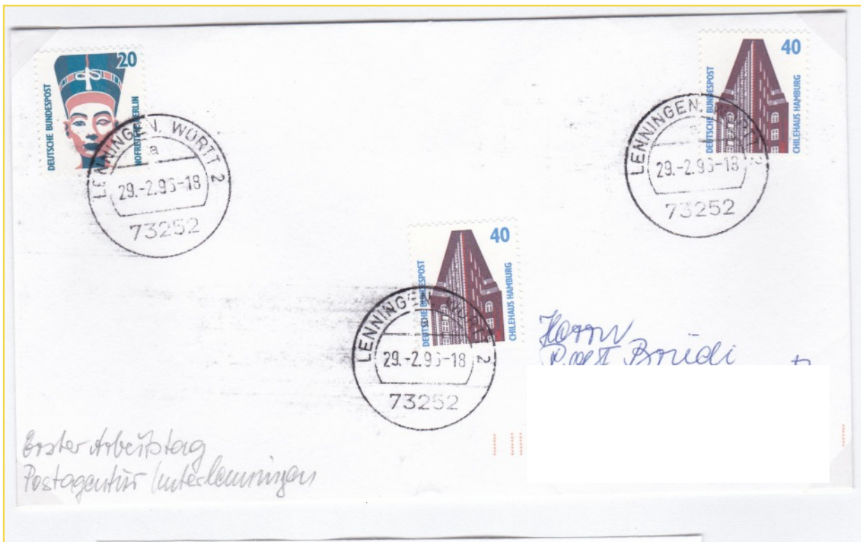
Brief von Unterlenningen - Lenningen 2 nach Nürtingen mit Stempel vom 29.2.96, dem Tag der Eröffnung der neuen Postagentur.