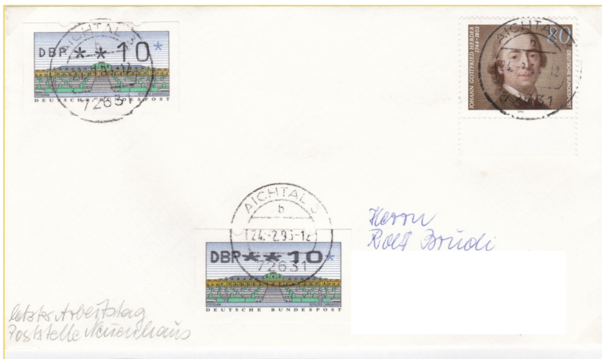
Standardbrief von Aichtal 3 (Neuenhaus) nach Nürtingen am 24.2.1996 (Tag der Schließung der Poststelle). Porto für den Standardbrief 100Pf. Stempel Aichtal 3 (b)