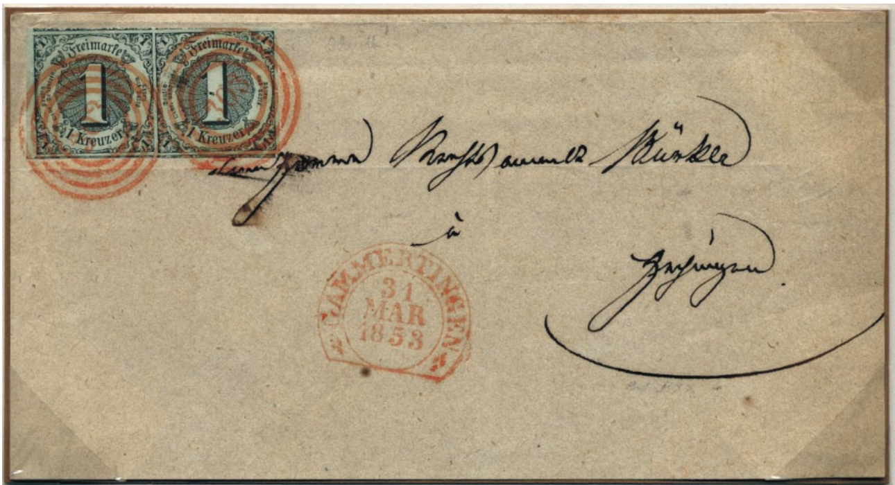
Brief von Gammertingen nach Hechingen vom Donnerstag, dem 31.März 1853