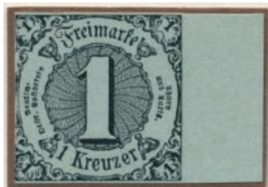
1 Kreuzer, Katalog-Nr. 7

Groschenwahrung (1 Thaler = 30 Silbergroschen) und in dem "Sudlichen Bezirk" war die Kreuzerwahrung (1 Gulden = 60 Kreuzer). Untereinander waren 1 Silbergroschen 3 Kreuzer wert. Die Markenzeit erstreckte sich vom Donnerstag, dem 1. Jan. 1852 (Ersttag) bis zum Sonntag, dem 30. Juni 1867 (Letzttag). Die Marken sind in einem Bogen mit 150 Marken im Buchdruck gedruckt. Es waren 10 Marken in 15 Reihen.