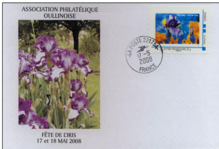
Die personalisierte Briefmarke zum Irisfest auf Schmuckumschlag