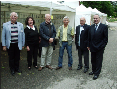
Gerne ließ sich der Parlamentarier und frühere Bürgermeister Michel Terrot (re.) fotografieren