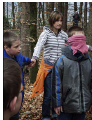
Der Weg eines Blinden im Wald wird gesichert