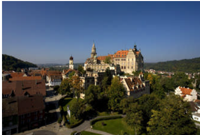
Schloss Sigmaringen

Der Verein der Briefmarkenfreunde Nürtingen/N. e.V. lädt Sie zu seinem Jahresausflug 2009 ein. Das Ziel ist dieses Mal das Obere Donautal mit seinen Hauptattraktionen Kloster Beuron und Schloss Sigmaringen.