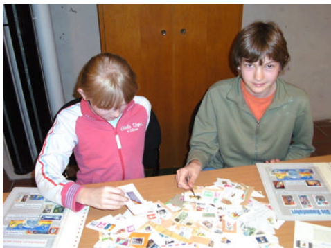
Zwei Eifrige suchen weitere Briefmarken zum Thema RAUMFAHRT