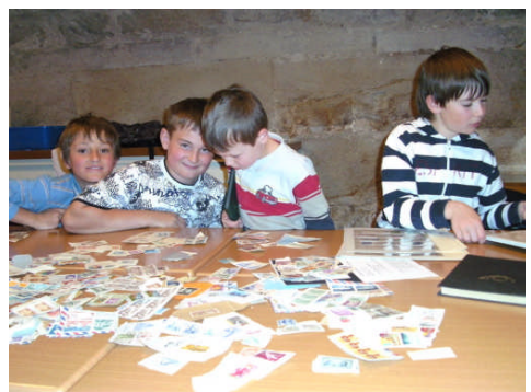
Das Suchen passender Briefmarken ist mühsam – also muss Spaß und Schabernack die „Arbeit“ erleichtern.