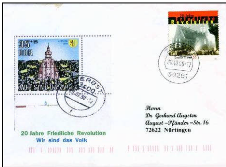
Schmuckumschlag zur friedlichen Revolution vor 20 Jahren

Ansonsten erwiesen sich unsere Zerbster Freunde wieder als fleißige Versender von Sonderbelegen, zwei davon sind hier abgebildet. Der eine erinnert an die friedliche Revolution in der damaligen DDR vor nunmehr 20 Jahren, die zum Fall der Mauer am 09. November 1989 und schließlich zur Wiedervereinigung geführt hat. Der andere, mit einem Sonderstempel von der Berliner Börse, ist unserem Landsmann Friedrich Schiller gewidmet, der vor 250 Jahren am 10. November in Marbach/N. geboren wurde. Beide Ereignisse stehen durchaus im Zusammenhang. Schiller war ja der Dichter der Freiheit, und mit Sicherheit hat sein unsterbliches Gedankengut die Ereignisse vor 20 Jahren, als sich die Menschen in der DDR gegen die Unfreiheit auflehnten, mit beeinflusst.