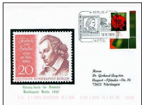
Schmuckumschlag zum Schiller-Gedenkjahr 2009

In Zeitungsartikeln in der NTZ vom 31. Oktober und 20. November, die über Besuche der Zerbster SPD bzw. der CDU in Nürtingen berichten, findet man übrigens einige interessante Aussagen zur dort vorliegenden Situation. So kann man zum Beispiel lesen, dass die Arbeitslosigkeit in Zerbst mit 12 Prozent als „relativ gering“ eingeschätzt wird. Höchst bemerkenswert ist auch die Feststellung, dass der Anteil der Mädchen an den Gymnasien bei 70 Prozent läge - was genau dem Anteil entspräche, den die Jungen an den Hauptschulen bilden! Und gerade diese gut ausgebildeten Mädchen und jungen Frauen würden dann zur Abwanderung neigen.