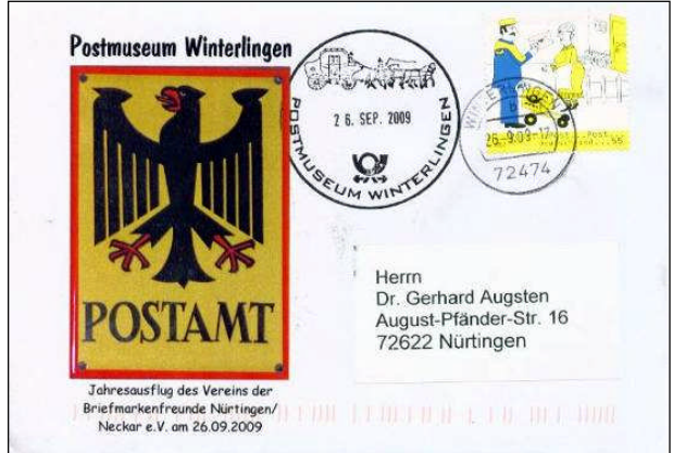
Zum Jahresausflug 2009 aufgelegter Schmuckumschlag

Zum Glück muss man bei uns im Ländle nicht weit fahren, um Sehenswertes und Neues zu erleben. So steuerte unser Bus der Fa. Bader mit 35 Vereinsmitgliedern beim Jahresausflug am 26. September dieses Mal das Hohenzollerische an (der Philatelist denkt dabei gleich an das Sammelgebiet Französische Zone – Südwürttemberg-Hohenzollern...).