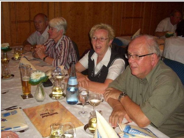
Ausklang im Forellenhof – das Ehepaar Stoll freut sich über einen gelungenen Ausflug

Ein Forellenschmaus in Honau an der Echaz setzte schließlich den Schlusspunkt unter einen weiteren gelungenen Ausflug unseres Vereins, der zwar „nur“ in die Nähe führte und eher von der gemütlichen Art war, dennoch aber sehr viel Neues und Interessantes geboten hat.