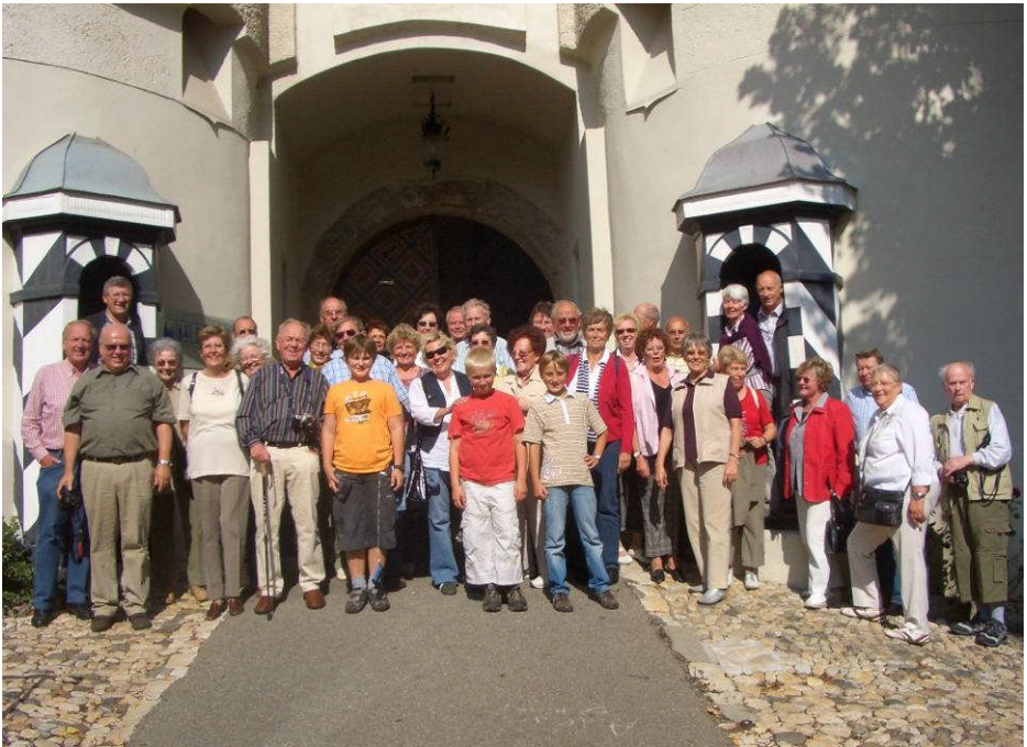
Unsere stattliche Reisegruppe vor dem Schloss Sigmaringen

Zu sehen waren die herrlich ausgestatteten Räumlichkeiten der Fürsten von Hohenzollern, wobei ein hochherrschaftliches WC mit traumhaftem Ausblick ins Donautal das besondere Vergnügen der Besucher hervorrief. In einem der Prachträume wurde man darauf aufmerksam gemacht, dass hier der greise Marschall Pétain noch die letzten Tage seines so genannten Vichy-Regimes zu Ende des 2. Weltkriegs verbrachte. Für die mitreisenden Jugendlichen war dann freilich die unvergleichlich reich ausgestattete Waffenkammer mit alten Rüstungen und mittelalterlichen Waffen aller Art die ganz große Attraktion.