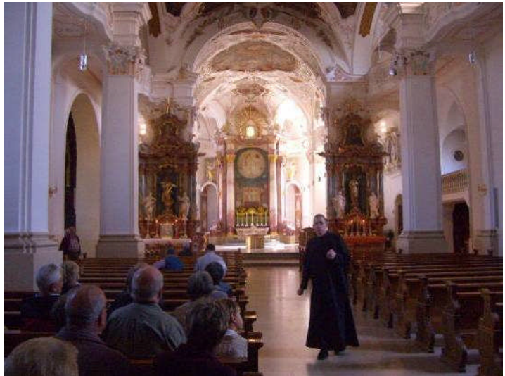
In der Klosterkirche Beuron