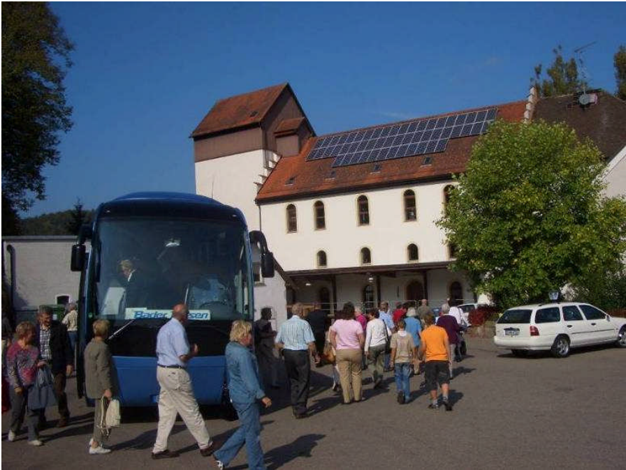
Bei strahlendem Wetter geht es zum Mittagstisch

sondern auch die Intention des barocken Baustils, den Gläubigen bereits auf Erden einen Einblick in künftige himmlische Freuden zu vermitteln und damit für den „rechten“ Glauben zu werben. Interessant war die Bemerkung von Bruder Maurus, der durch die Kirche führte, dass das Kloster in besonderer Weise unter dem Preußischen Kulturkampf gegen Ende des 19. Jahrhunderts gelitten habe - ganz einfach deshalb, weil man ja damals (leider) zu Preußen gehörte!