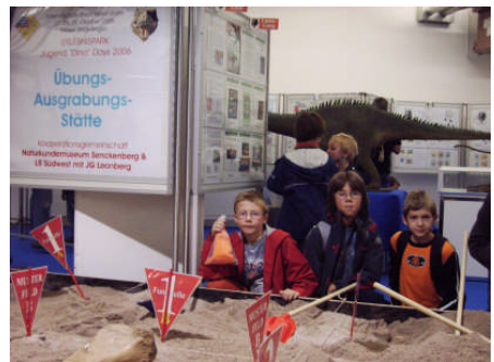
Das Grabungsfeld vor der Gruppe, einen Dino im Rücken und Briefmarken dahinter – wer will noch mehr?