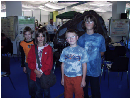
Zum Besuch der Dino-Days gehörte natürlich das Foto vor dem Schädel eines Tyrannosaurus