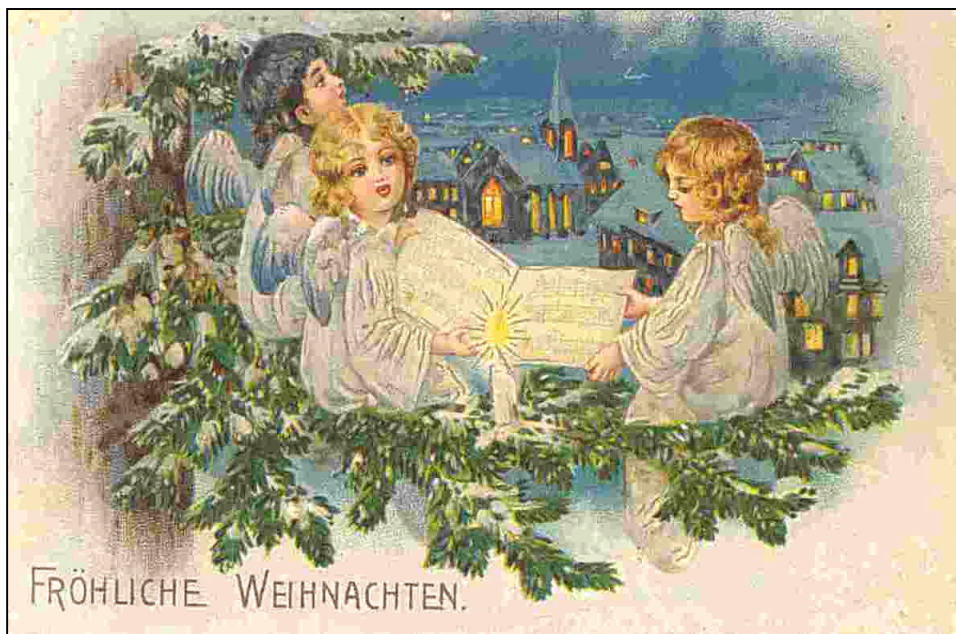
Weihnachtskarte von 1906

Frohe Weihnachten und alles Gute zum Jahreswechsel wünscht die Vereinsführung