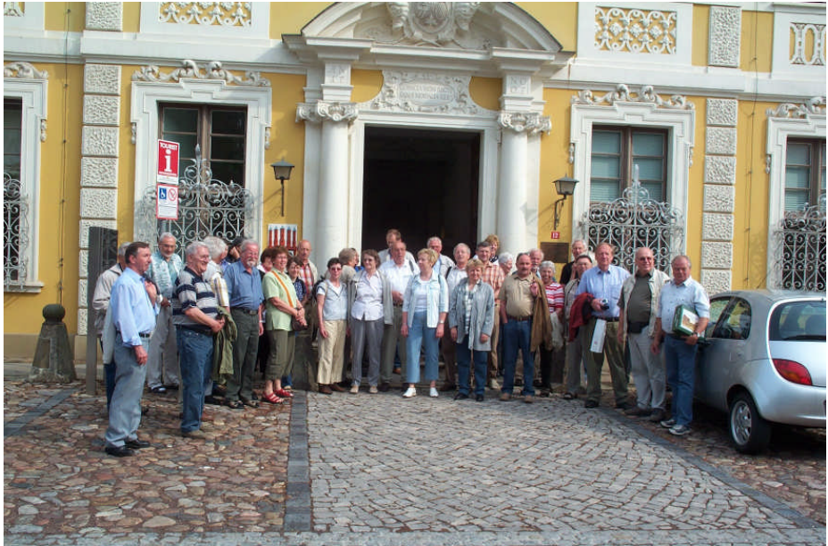
Unsere Gruppe vor dem Rathaus

Weitere Ziele des Ausflugs waren Dessau mit dem weltbekannten Bauhaus und dem Technik-Museum Hugo Junkers, die Lutherstadt Wittenberg und das Gartenreich Wörlitz – alles Stätten des UNESCO-Weltkulturerbes, die in diesem geschichtlich und kulturhistorisch einzigartigen Gebiet so dicht gedrängt sind wie sonst nirgends.