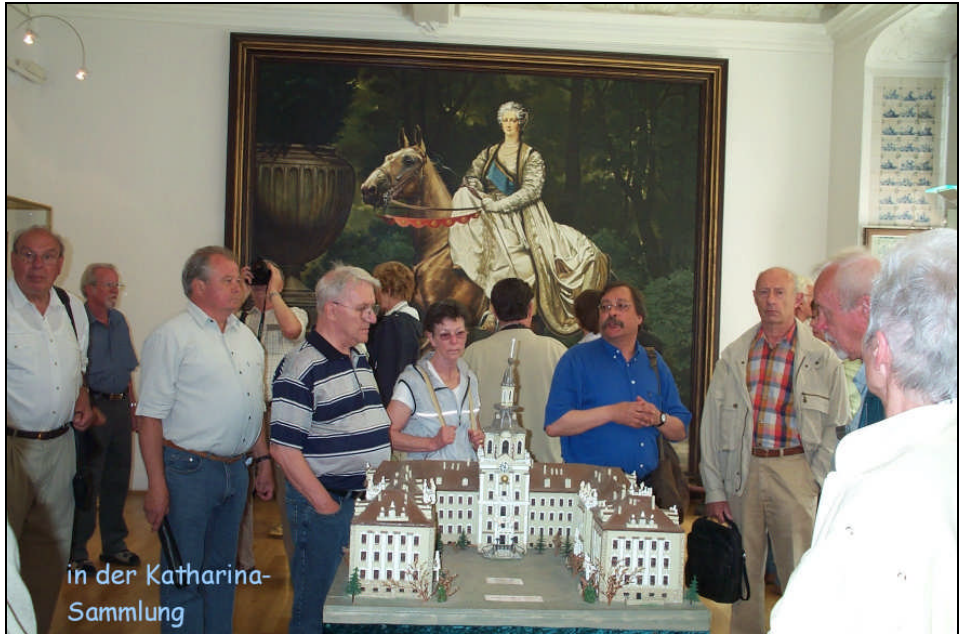
Gruppe in der Katharinensammlung

PS: Interessierten steht eine CD mit mehr als 300 Fotos im ipg-Format von Siegfried Stoll, Gerhard Augsten und der Pressestelle der Stadt Zerst zur Verfügung. Nach Überweisung von € 10,- zzgl. € 2,50 Versandkostenanteil auf das Vereinskonto 500 465 002 bei VoBa Kirchheim/Nürtingen, BLZ 612 901 20, wird diese gerne zugesandt.